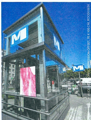
ALICE, NOS CORPS, IMPRESSION OFFSET, 70 X 100 CM, HOODEBEEK