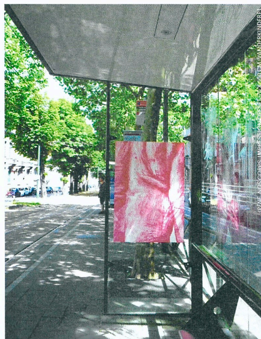
IRENE, NOS CORPS, IMPRESSION OFFSET, 70 X 100 CM, WANDERKINDEREN