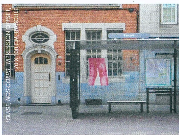
LOUISE, NOS CORPS, IMPRESSION OFFSET, 70 X 100 CM, BRUXELLES