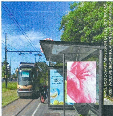
JEANNE, NOS CORPS, IMPRESSION OFFSET, 70 X 100 CM, ARRET WOLUWE SHOPPING, AERCHERIE