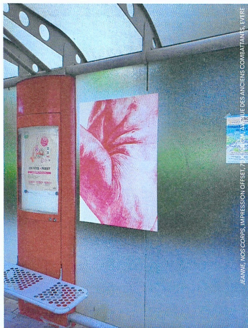
JEANNE, NOS CORPS, IMPRESSION OFFSET, 70 X 100 CM, AV. RUE DES ANCIENS COMBATTANTS, EVERE