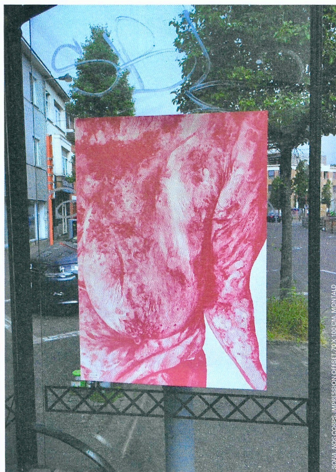
SOEFA, NOS CORPS, IMPRESSION OFFSET, 70 X 100 CM, MONTAIGL

Au cours des dernières semaines, vous avez peut-être aperçu ces images dans la ville ? Pour son exposition Katharsis à la Médiatine, l'artiste Camille Dufour a invité le public à emporter ces impressions pour les afficher dans les rues de Bruxelles. Nos corps est un projet d'affichage urbain interrogeant l'idéalisation omniprésente du corps des femmes dans l'espace public. En regard, les milliers d'impressions accrochées à même les murs de la ville sont une tentative de rendre visible ce qui d'ordinaire reste caché. Un travail de visibilité de la diversité des corps des femmes, de leurs singularités. Plus d'infos sur son site www.camille-dufour.be